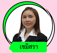
เชมิสร่า